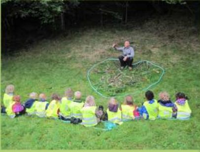
Arbeid med inkludering og vennskap