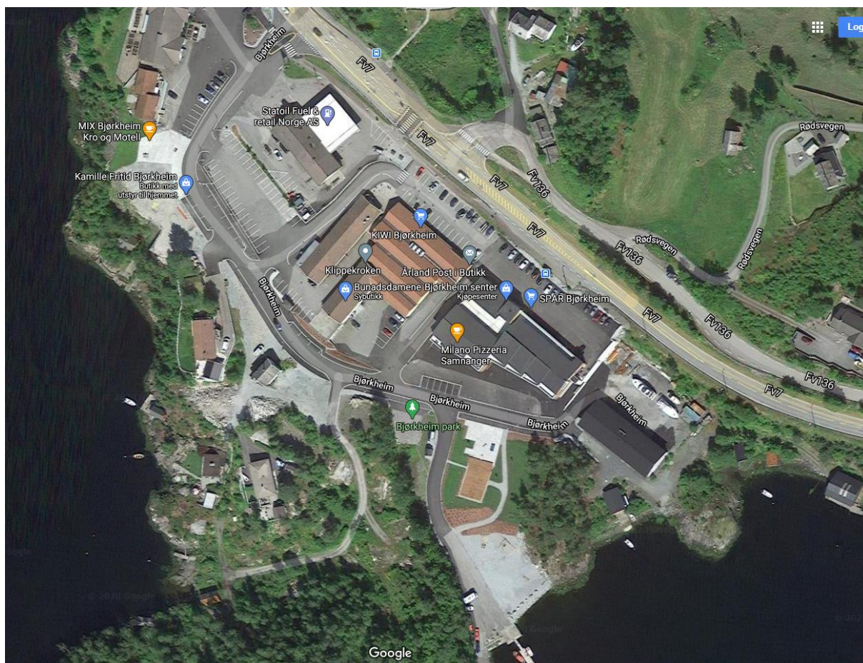
Figur 1. Satellittfoto av Bjørkheim frå Google Maps. Dette er det nyaste biletet som er å finna, men det manglar «Kamille»-bygget og ein del nye bustader på sørsida.

Administrasjonen tek utgangspunkt i at moglegheitsstudiet skal vera ein del av planprosessen for revisjon av områderegeringsplanen. Ein kan likevel sjå for seg at ein del av resultatane frå studiet kan gjennomførast utan planendringar.