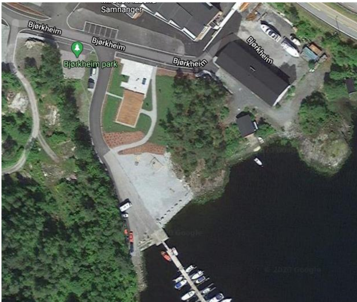
Figur 3. Satellittfoto frå Google Maps rundt torg, park, gjestehamn og kommunen si ubygde tomt F/K/T1.